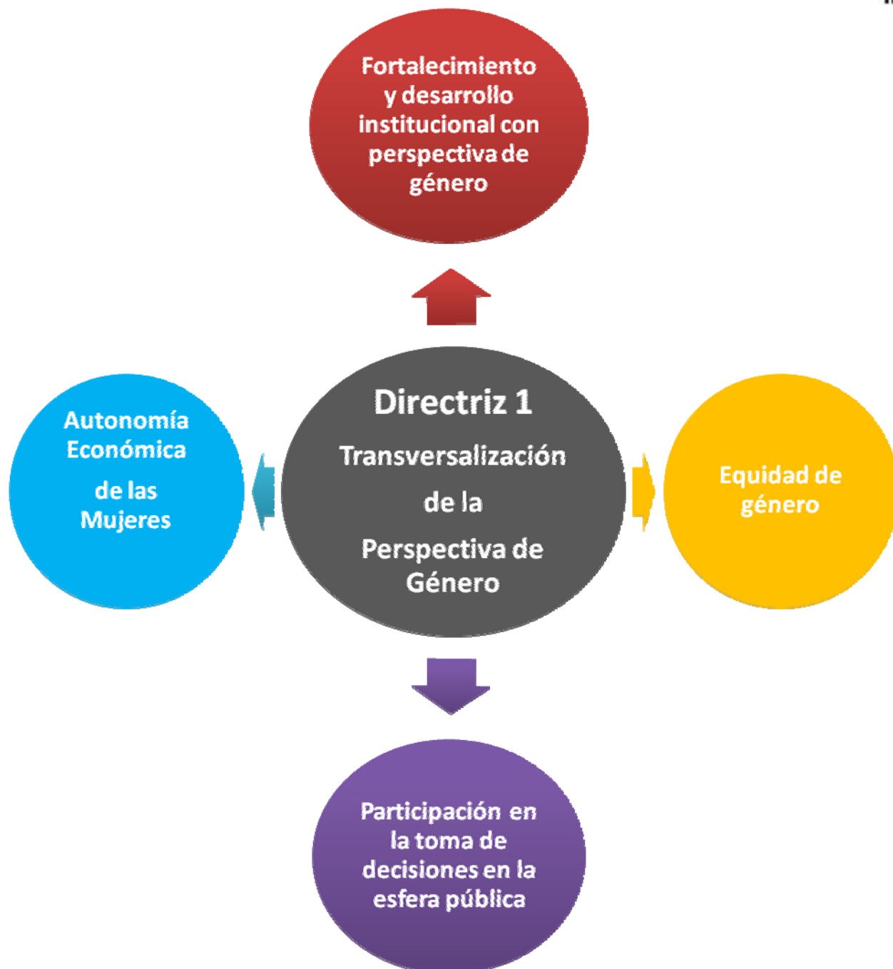
Esquema de los subtemas propuestos por Plan Estatal de Desarrollo